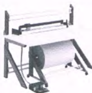
Pneumatik-Anbau-Schneidvorrichtung für Hinterkante an Tisch 503000, Klemmbereich bis 70 mm, nicht nur an 503000 sondern auch 203000 zu montieren. 57112 passt jedoch nur an 203000.

max. Rollengewicht: 200 kg max. Rollen-Ø 750 mm