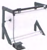
Pneumatik-Schneidständer, waagrecht Druckluftanschluß 6 bar (max) Austrittshöhe 890 mm