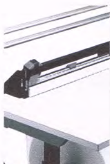
Anbau-Schneidvorrichtung für Hinterkante an Tisch 503000, Klemmbereich bis 70 mm, nicht nur an 503000 sondern auch 203000 zu montieren, 55116 passt jedoch nur an 203000