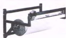
Wand-Schneidgerät Achse -Ø 32 mm